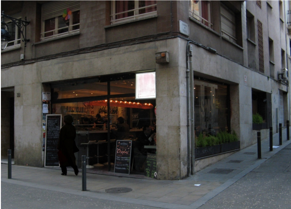
Figura 1. Fotografía exterior del local en calle Asturias (barrio de Gracia)

A continuación el análisis desarrollado in situ por el primer agente, que no es arquitecto ni experto en acústica.