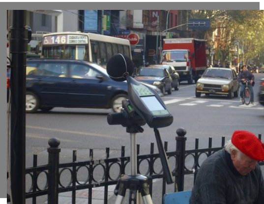
Fotografías 1 a 6: Vista de algunos puntos de medición