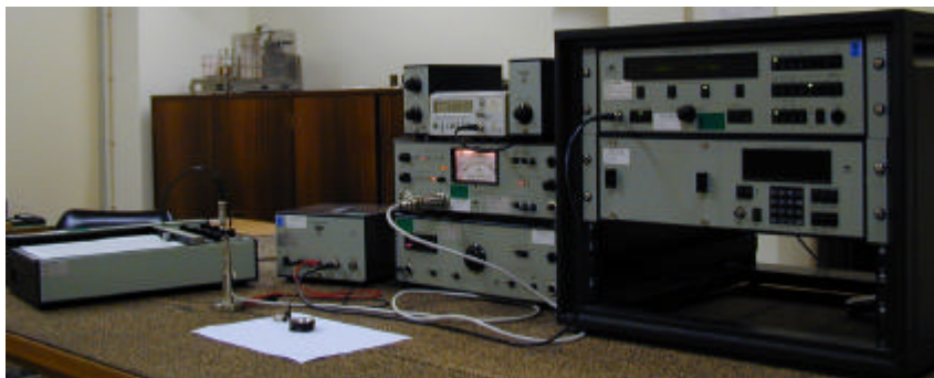
Figura 2 – Instrumentação utilizada na determinação da característica de resposta em frequência de microfones de condensador

necessárias para a geração da força electrostática no diafragma do microfone, enquanto que, o gerador de sinais, modelo 1049, controla o varrimento em frequência da tensão sinusoidal e do registo gráfico do sinal obtido no gravador X-Y modelo 2307.