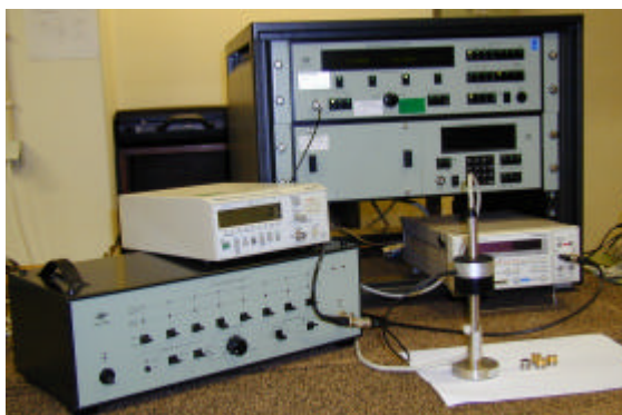
Figura 3 – Calibração de um microfone de condensador pelo método da comparação

A implementação experimental do método de comparação para a determinação da sensibilidade à pressão de microfones recorre à utilização de um acoplador activo para a comparação de microfones de meia-polegada do fabricante Bruel & Kajer, modelo WA 0817, alimentado pelo gerador de sinais sinusoidais modelo 1049; de dois pré-amplificadores com características iguais (neste caso utilizaram-se pré-amplificadores do mesmo modelo), de um multiplexador para pré-amplificadores de microfones modelo 2811, e de um multímetro para leitura dos sinais em tensão relativos a cada microfone. A figura 3 apresenta uma fotografia do equipamento anteriormente referido.