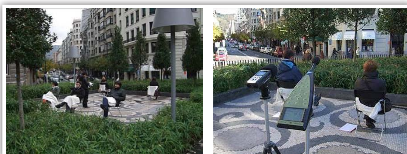
Figura 1. La influencia de la ausencia de sonidos contaminantes en la capacidad restauradora de los espacios no está suficientemente probada aunque hay análisis experimentales que arrojan resultados prometedores[3].

Si bien esta legislación no define la Zona Tranquila Urbana, se puede entender que el concepto homónimo sería: Zonas tranquilas en aglomeraciones y que, según el artículo 3 del la Directiva 200249/CE se define como el espacio, delimitado por la autoridad competente que, por ejemplo, no está sometido a niveles superiores a un